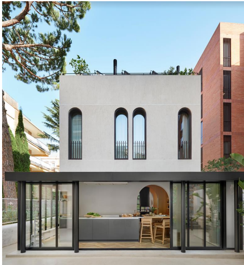
Proyecto Villa Leonor. Barcelona.

“Las personas y el entorno son la base de nuestros proyectos, pensados para crear espacios cálidos, que interactúen con el ser humano y respeten el territorio”